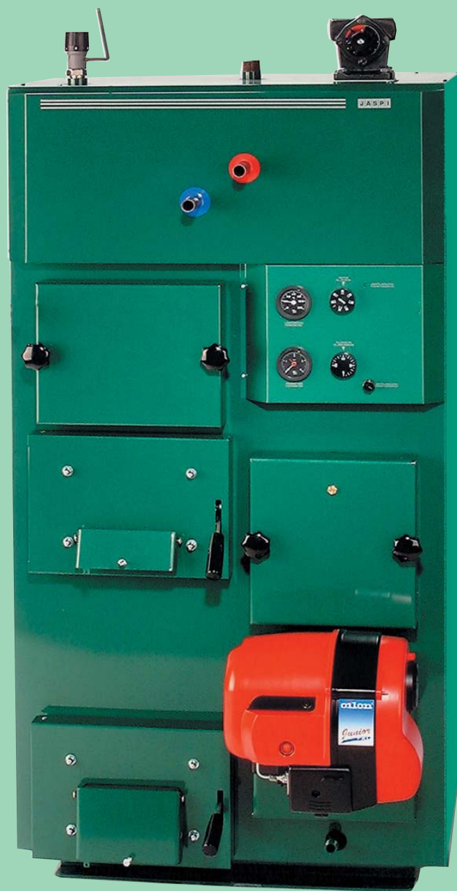
Горелка на фото не входит в стандартную поставку

При разработке и изготовлении использованы новейшие технологии в данной области, результатами которых является надежный в работе, прочный и долговечный котел с высоким к.п.д., который является верным выбором ценящего качество клиента.